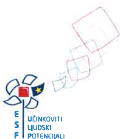
Ivo Bilić, dipl.ing.