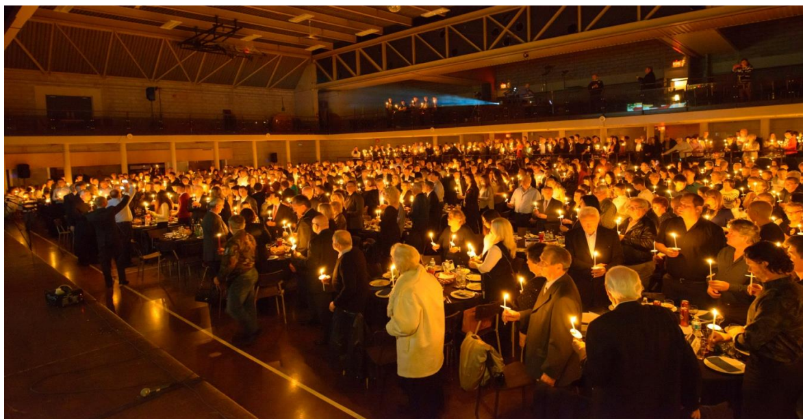
Dijeljenje plamena “Vukovarskog svjetla“, Toronto, 1200 gledatelja i 150 izvođača

Spektakl “ Plamen Vukovarskog svjetla“ je glazbeno-scenska predstava kroz koju pričamo priču o gradu Vukovaru prije rata, kako je grad branjen tijekom “Bitke za Vukovar“ i o gradu Vukovaru danas. Tijekom spektakla prikazuje se tri filma: “Plamen Vukovarskog svjetla“, “Bitka za Vukovar“ i “Vukovar danas“ te se održavaju ceremonije unošenja, blagoslova i dijeljenja plamena donesenog iz grada Vukovara.